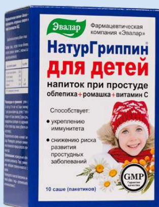
Напиток для детей