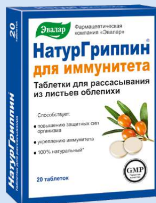
Таблетки для рассасывания