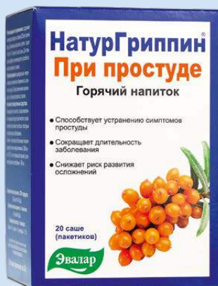
Напиток для взрослых

«НатурГриппин» — 100% натуральная помощь при гриппе и простуде На основе экстракта листьев облепихи