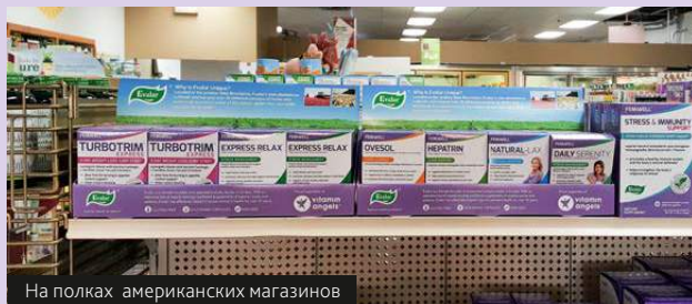
На полках американских магазинов

приверженцев здорового питания. Ведь прежде чем купить, в Америке принято пробовать! А те, кто уже оценил эффективность российской продукции с маркой «Эвалар», приобретают ее в интернет-магазинах США, как это принято за океаном, и в одной из самых крупных онлайн-торговых площадок мира интернет-магазине Amazon.